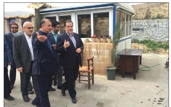
بازدید رئیس شورای اسلامی شهر شیراز و معاون خدمات شهری شهرداری شیراز از مراکز خدمات رسانی نوروزی