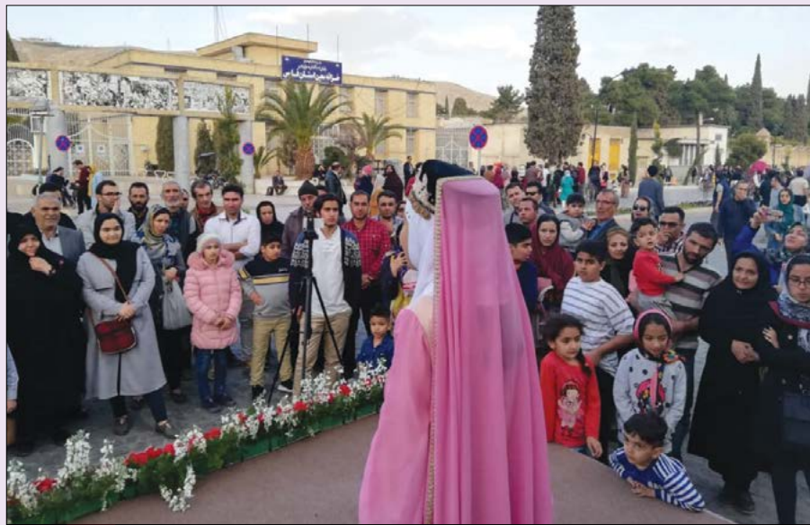
«شیراز از گل بهترو» یک جاذبه جدید گردشگری برای شیراز است